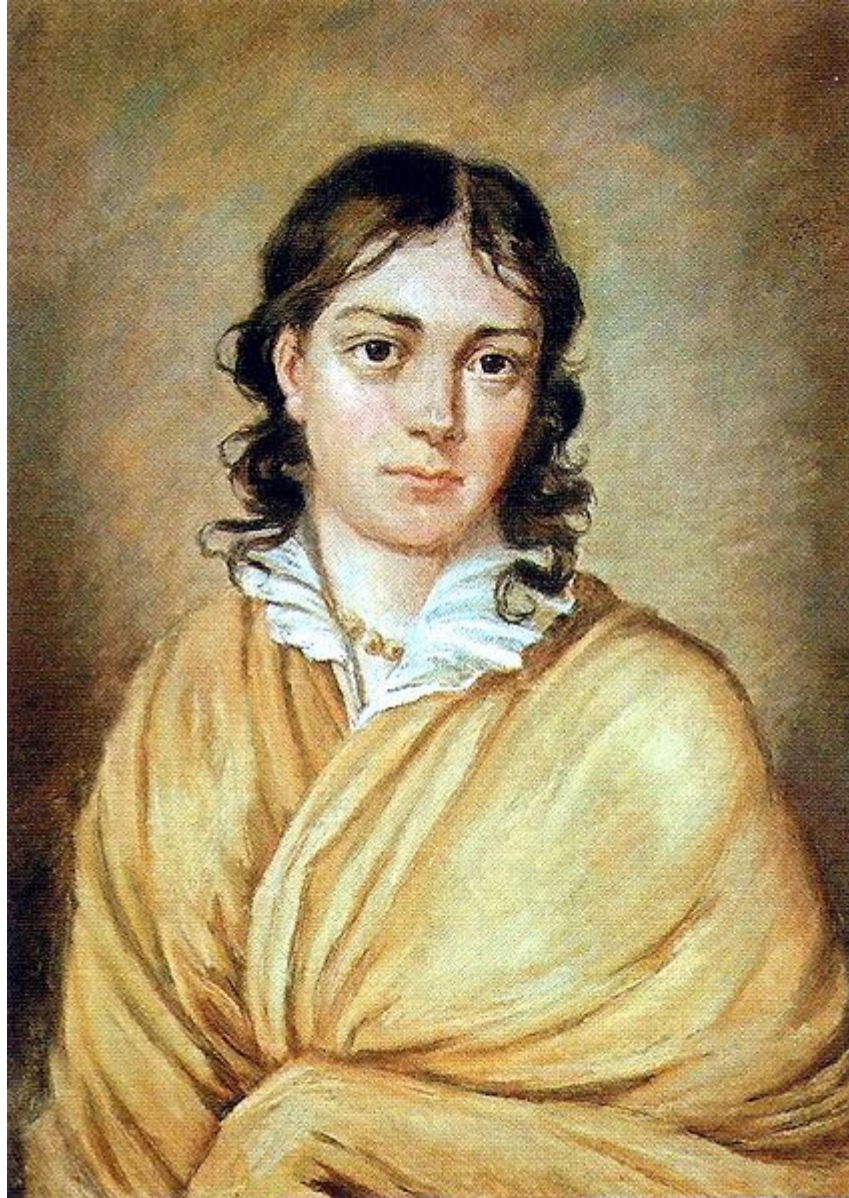
ELISABETH (BETTINA) VON ARNIM (1785-1859)