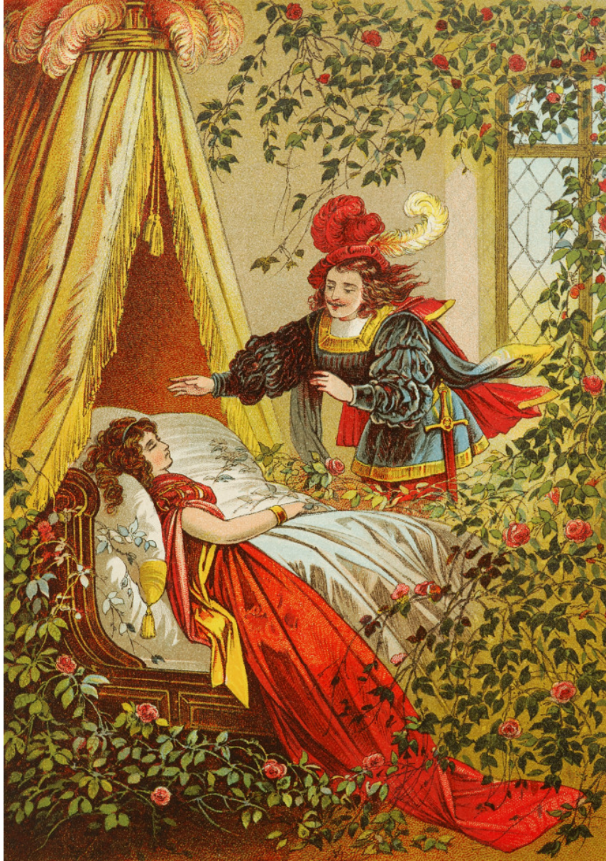
ROSULAM SPINOSAM A PRINCIPE EXPERGEFIERI Quam saec.19. exeunte pinxit Heinrich Leutemann sive Carl Offerdinger.