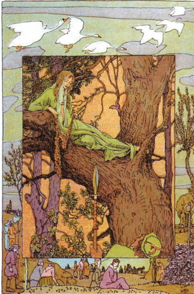
„SEX OLORES“ AB HENRICO VOGELER PICTI.

Misera autem puella cogitavit haec: »Nolo diutius hic remanere, proficiscar fratres meos quaesitura«. Cum obtenebresceret, ea mediam in silvam aufûgit. Puella per totam noctem diemque sequentem migravit, usquedum fatigatior erat, quam ut migrare pergeret. Tum ea vidit casam silvestrem et ascendit et invênit cellam sex lectis instructam, sed non ausa est se in aliquo eorum collocare, sed repsit sub aliquem lectum, decubuit in sôlo duro, ubi voluit pernoctare. Sole autem occasuro puella fremitum audivit et sex olores per fenestram intro volantes. Qui in sôlo se consederunt, unus alterum afflavit et afflando omnes pennas sustulit, et cutis eorum olorina tamquam camisia est dstricta. Tum puella illos aspiciens fratres recognovit et laetê erepsit e loco sub lecto posito. Fratres autem sororculâ aspectâ haud minus laetati sunt, sed breviter tantum. Nam dixerunt: »Hîc non poteris remanere. Hoc est deversorium raptorum, qui, si domum ierint teque invenerint, te occîdent« Tum