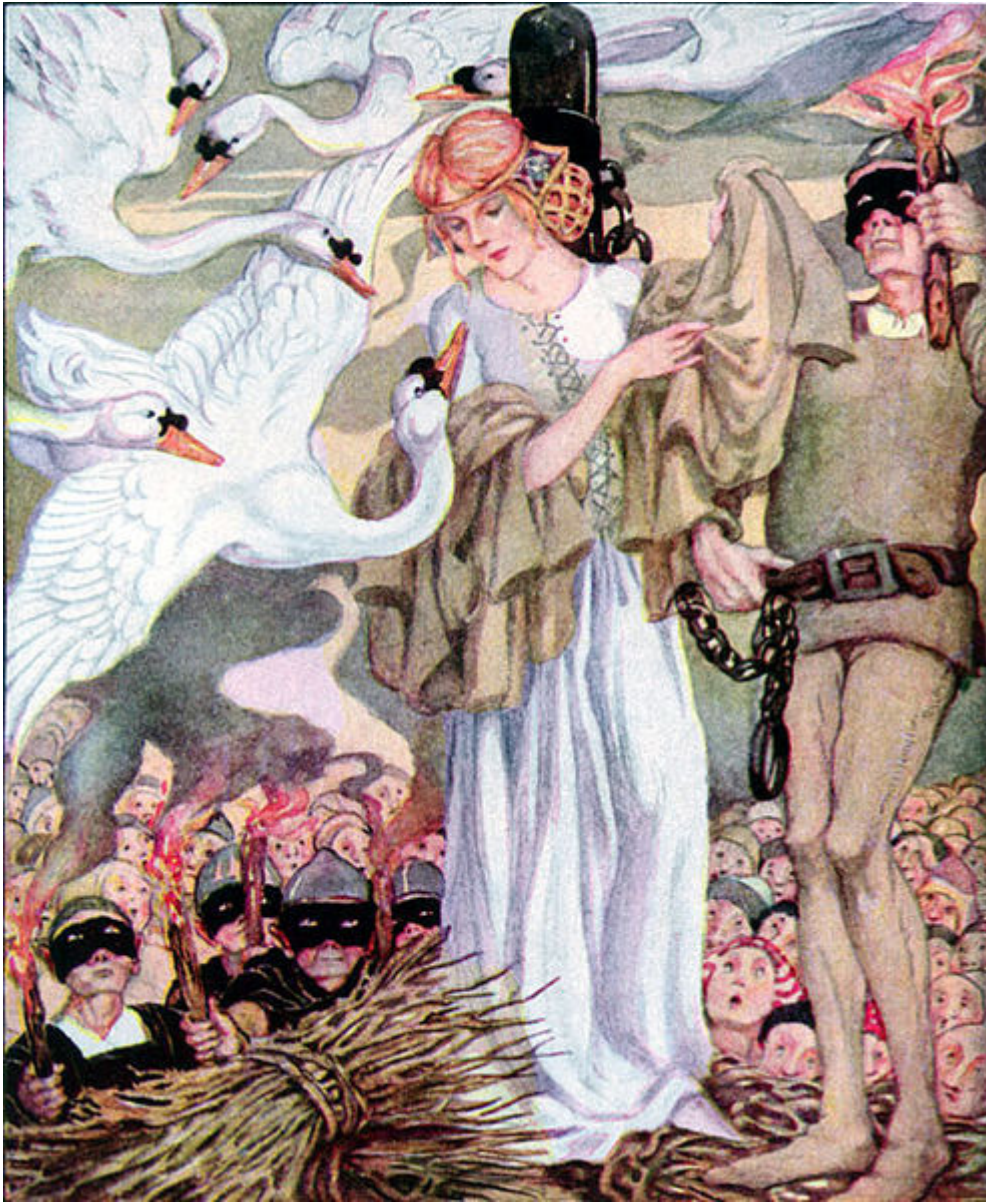
ECCE SEX OLORES AB ANNE ANDERSON PICTI (a.1922)

Aliquando rex in silvâ magnâ venans aliquam bestiam feram tam vehementer venatus est, ut nemo comitum eum sequi posset. Cum advesperasceret, ut consisteret et circumspectaret, rex animadvertit se viâ deceptum esse. Quarebat, ubi ex silvâ exiret, sed non invênit. Tandem anum vidit capite vacillante sibi appropinquantem; quae fuit malefica. Quam allocutus rex: »Cara mulier, nonne scis mihi dicere, qua viâ ex silvâ exeam?« - »Certê« illa respondit, »hoc scio, Domine Rex, sed est quaedam condicio, sine qua numquam ex silvâ exhibis et in eâdem fame peribis.« »Quaenam est haec condicio?« rex interrogavit. »Est mihi,« anus inquit, »filia, qua pulchriorem in mundo non invenies, et ea verê digna est, quae fiat uxor tua; quam si in matrimonium ducere