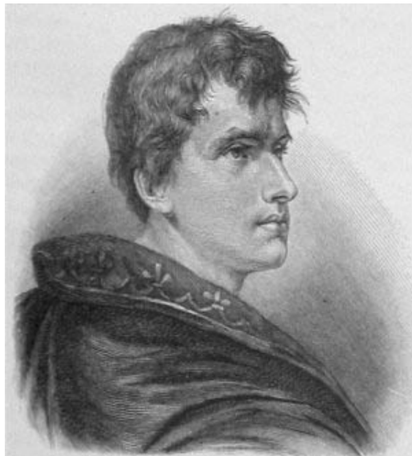
ACHIM VON ARNIM (1781-1831)