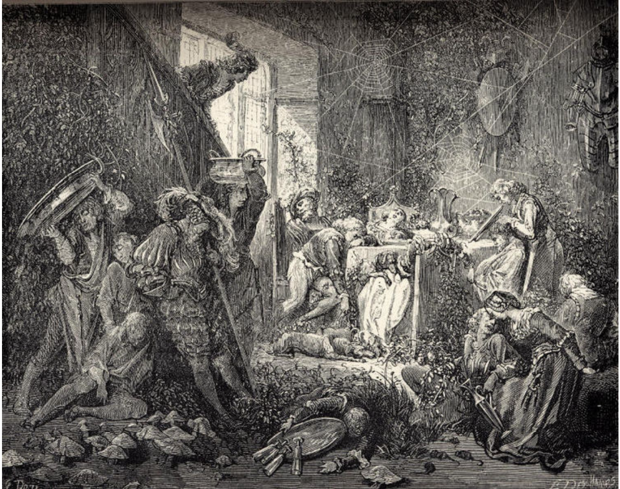
ECCE AULICOS SOMNO CENTENNI 1 CAPTOS, A GUSTAVO DORÉ A.1867 DELINEATOS.

Hic autem somnus passim valere coepit per totum castellum: rex et regina, qui modo oecum intraverant, obdormiverunt et unâ cum iis omnes aulici. Tum obdormiverunt equi in stabulo, canes in aulâ, columbae in tecto, muscae ad parietem, immo, ignis, qui flagrabat in foco, quievit et obdormivit, caro quae in sartagine assabatur desiit sonum êdere et coqus tironem culinarem, qui aliquid peccasset, crinibus trahendis puniturus, illum amisit et obdormivit. Et ventus remisit et in arboribus ante castellum sitis ne foliolum quidem motum est. Circa autem castellum coepit crescere saepes spinosa, quae quotannis altior facta est, qua denique totum castellum est circumdatum et quae super castellum tantopere crescebat, ut nihil iam castelli videretur, ne vexillum quidem tecto impositum.